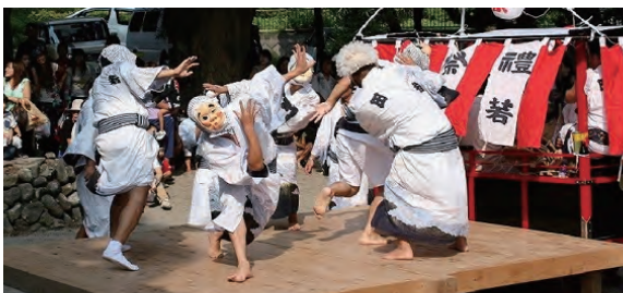
田牛八幡神社おっぴいしゃり（バカ踊り）