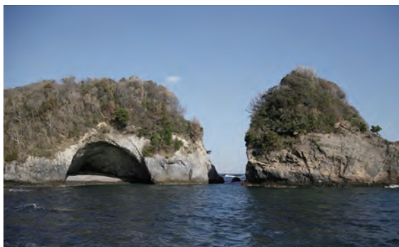
三日月の大洞と遠国島

ラブパワースポットとして人気の龍宮窟から弓ヶ浜まで続くタライ岬遊歩道、 源頼朝が隠れたといわれる遠国島や三日月の大洞など、散策コースも豊富です。