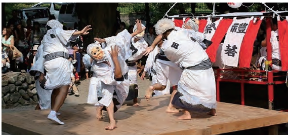
田牛八幡神社おっぴいしゃり（バカ踊り）